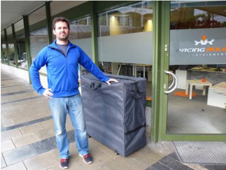
Stabiler Stand (beladen mit 8 Rahmen)