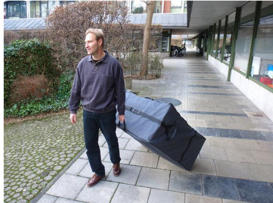
Einfaches ziehen (zwei Rollen)